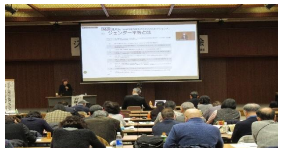
学習会会場 (連合会館2階大会議室)

講演終了後の意見交換では、web参加者の方も含め多くの方から時間ギリギリまで質問やご意見をいただきました。