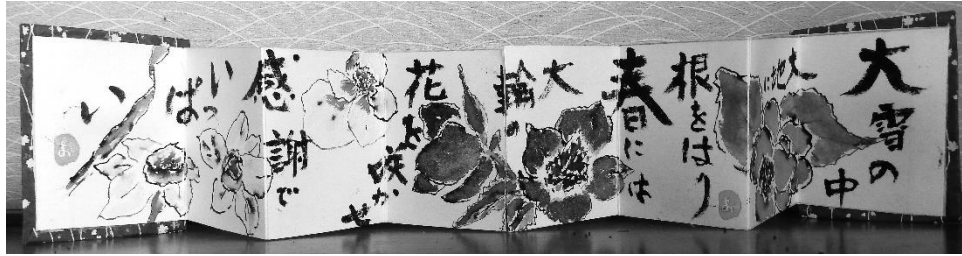
(牛乳パックの側面を2枚横に貼り合わせ、屏風仕立てに描いた作品です)