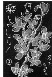
(黒色印刷の葉書文面に絵を描き、字は白ペンで書いています)