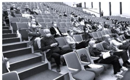
(決意を聞き入る退職者の会の出席者)

人を大切にし、価値を作り出し、人々を幸せにする生み出す改革を実現するために、5つの政策を柱にすえ政治の道で全力を尽くすことを覚悟しました。