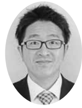
新教組執行委員長