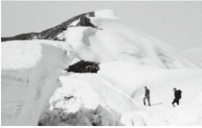
百字ヶ岳への稜線を歩く

日脚が延びた5月、山菜を採り、残雪を踏みしめ辿る山稜の爽快感は何物にも代えがたい。