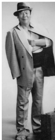
(年賀状に使った「寅さん」の正装)