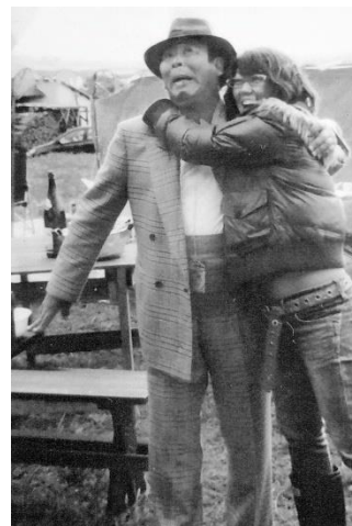
(テレビ朝日「人生の楽園」撮影時、ディレクターと)

A 三食自分で料理して、好き嫌いなく食べます。畑をやっている、結構広いので農作業はいい運動になります。数年前に、脊柱管狭窄症になり、元気な時のように無理はできませんが、春は山菜を採りに行ったり、秋は魚釣りや蛸捕りを楽しんでいます。お酒とコーラは止めたのですが、タバコはなかなか止められません。少しずつ減らそうと思っています。