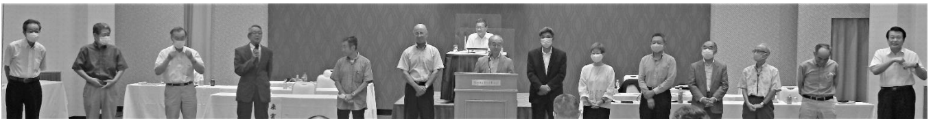
【新役員のあいさつ（2名欠席）】