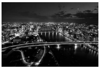
⑥ メディアシップからの夜景