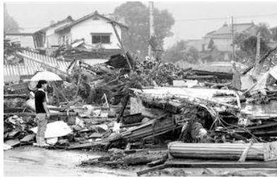
（生まれ育った実家があった場所に立つ女性） 「悔しいですね こんなことになるなんて」と涙を拭った