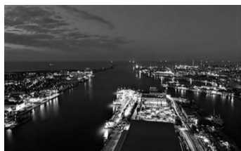
⑤ ときメッセから日本海