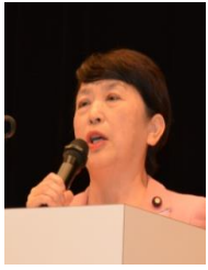
福島みずほ 社会民主党副党首