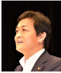
玉木雄一郎 国民民主党代表