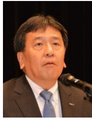
枝野幸男 立憲民主党代表