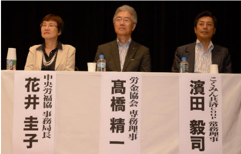
実行委員会構成団体代表のみなさま

関係を持つているところは魂の入った改革が可能です」「政治も有権者が主役になっているのだろうか。今の野党の動きを支えたいと思います」