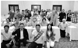
（7/17 新潟支部退職者の会の個人演説会で）

県内各支部の退職者の会は、支部幹事会を中心に 1 年 4 か月の長期間にわたる選挙戦を頑張り抜いたという自負と、手応えを感じていた支部がほとんどでした。しかし結果は、県内では「前回なんば票」を下回った市町村が多く、全国でも 4 万 7 千票を減らし、奇しくも 9 年前の「なんば初挑戦」と、ほぼ同数の得票となりました。