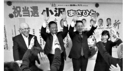
（開票日の当確報道でバンザイ！）

その結果、3 年前の「なんば選挙」時より、会員（会費納入人員）が、1 4 0 名減ったにも拘わらず、後援会加入票は 6, 5 8 9 票で 9 8. 4 % と、ほぼ前回並みの加入数を集約し、底力を発揮することができました。