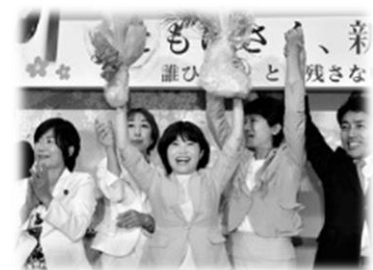
（当選確実で沸く選対本部）